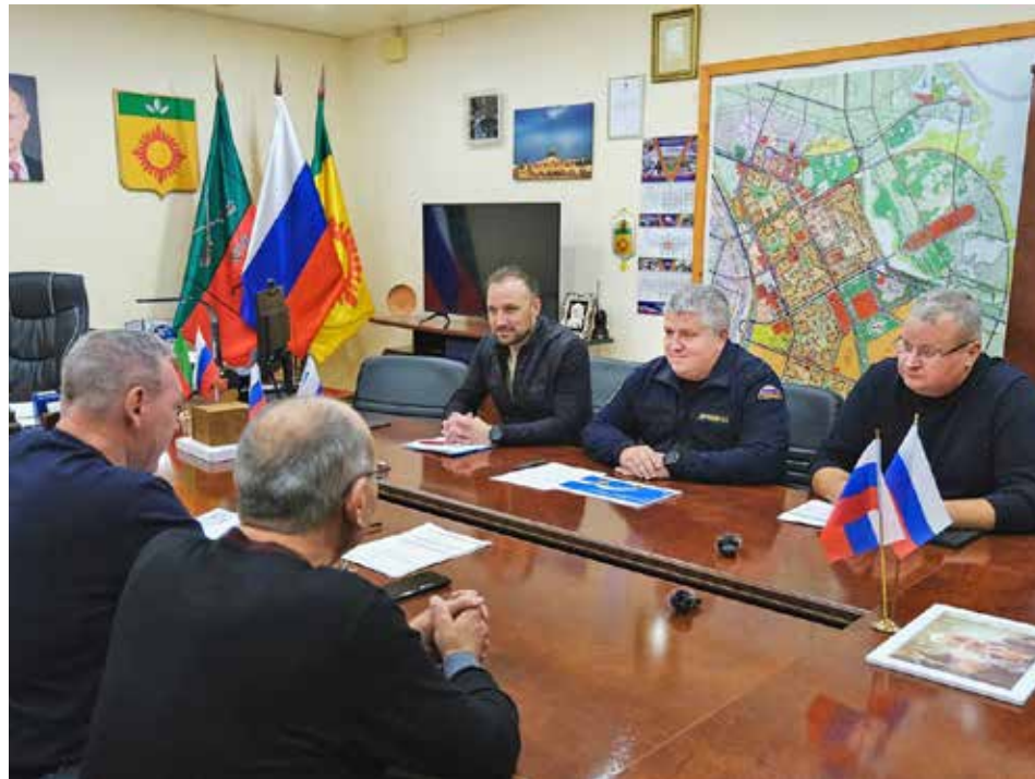
На официальной встрече были подведены итоги текущего года и определена конкретная помощь по каждому объекту.

— Город готов поддержать ребят. Мы ставим перед собой амбициозную задачу, чтобы они не просто заявили в 2026 году на ЧВТ, а именно приняли участие. Приложим все усилия для того, чтобы максимально их подготовить и показать достойные результаты. Это колоссальный опыт, который необхо-