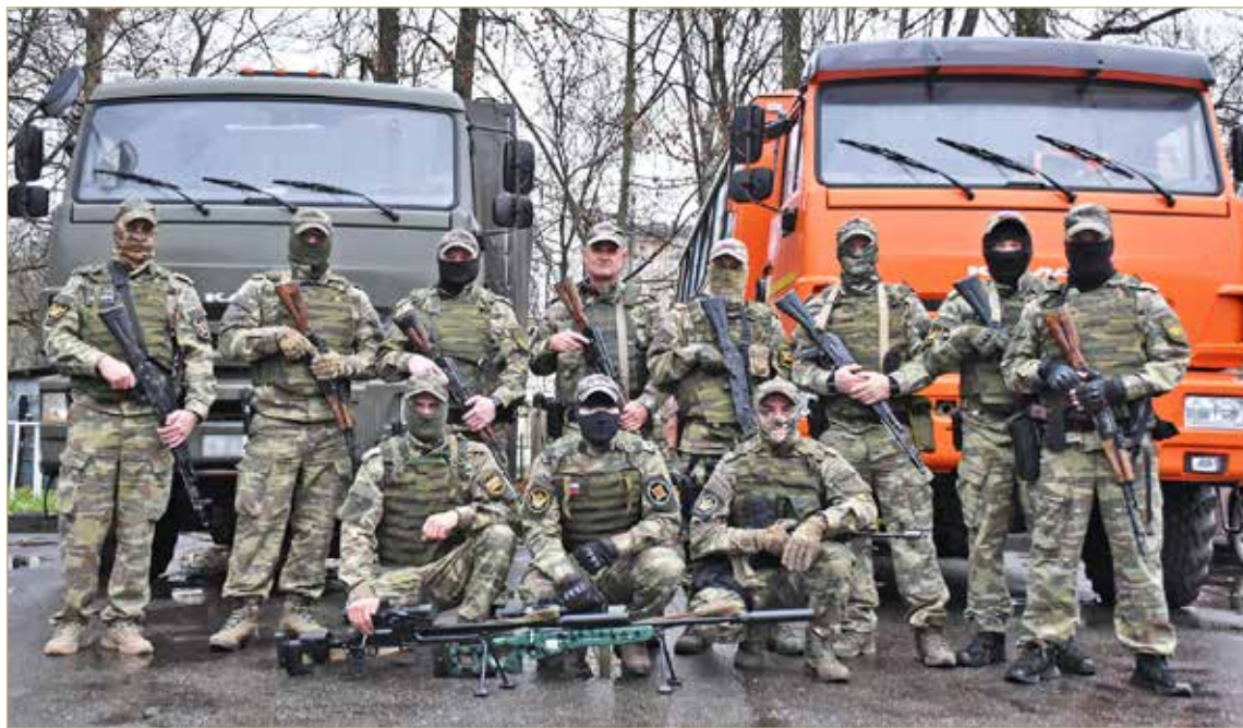
Служба в спецназе не для тех, кто хочет работать без лишнего риска. Она по плечу не каждому. В отряде «Русич» случайных людей нет.

В отряде в большинстве своём — новгородцы. Несмотря на то, что «Русич» — подразделение серьёзное, оно занимается военно-патриотическим воспитанием подрастающего поколения. Много лет сотрудничает с клубом спортивных единоборств «Искра». Для его юных участников