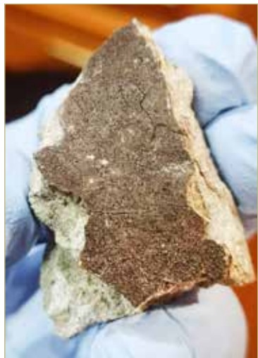
Обломок метеорита, найденный в Окуловском районе, исследовали в лабораторных условиях.

Стоимость осколков метеоритов зависит от множества факторов: типа объекта, его редкости, состава, веса, состояния. Например, фрагменты с драгоценными металлами (золото, платина) могут стоить дороже. Учёные предполагают, что стоимость фрагмента, упавшего в Новгородской области, может составить 500 рублей за грамм.