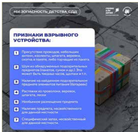
Инфографика с официальной страницы ВК уполномоченного по правам ребёнка в Новгородской области