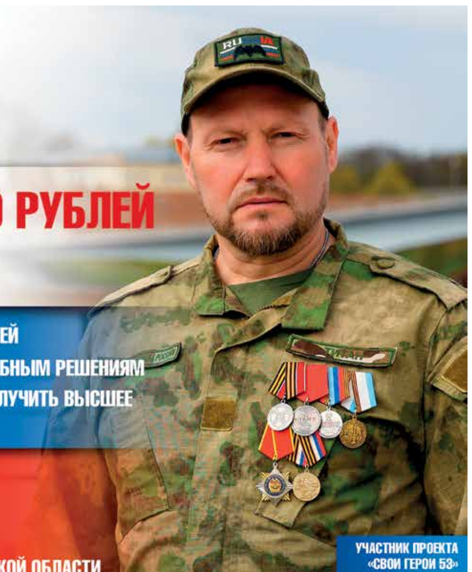
УЧАСТНИК ПРОЕКТА «СВОИ ГЕРОИ 53»