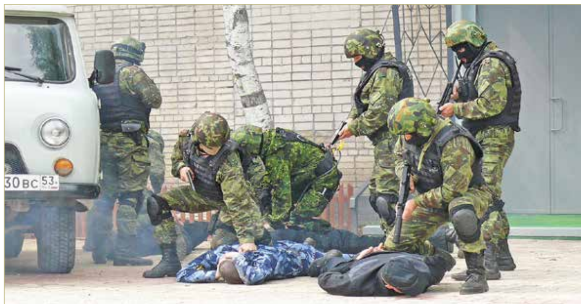
Систематически бойцы спецназа тренируются в полной экипировке, чтобы максимально приблизить учения к реальности.

Традиционно последние несколько лет бойцы отряда «Русич» накануне Нового года помогают организовать благотворительную акцию для маленьких пациентов областной детской больницы. На них самая сложная её миссия — с помощью альпинистского снаряжения в костюмах Деда Мороза спуститься с крыши здания и поприветствовать детей, чтобы они почувствовали праздник. Необычное появление новогодних волшебников всегда становится невероятным сюрпризом не только для малышей и их родителей, но и для медицинского персонала.